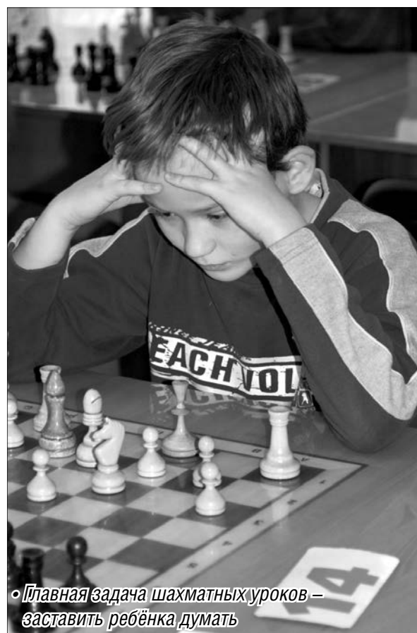
Главная задача шахматных уроков – заставить ребёнка думать