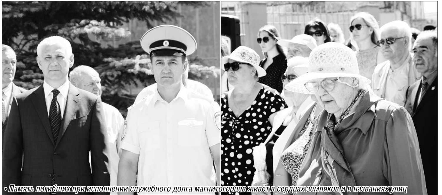
Память погибших при исполнении служебного долга магнитогорцев живёт в сердцах земляков и в названиях улиц

Горожане, полицейские, ветераны почтили память погибших в Аргуне