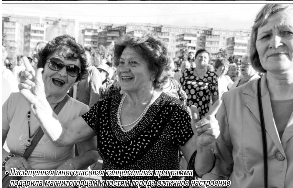
Насыщенная многочасовая танцевальная программа подарила магнитогорцам и гостям города отличное настроение